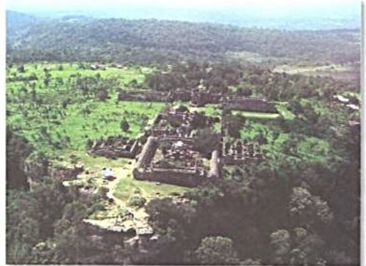
ปราสาทพระวิหาร

4 การรื้อฟื้นคดีกับการยื่นขอตีความคำพิพากษาเหมือนกันหรือไม่ ไม่เหมือนกัน การรื้อฟื้นคดี คือ การขอให้ศาลโลก