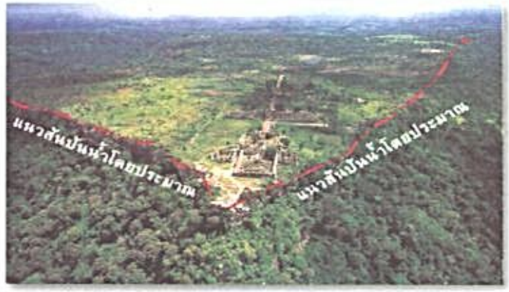
ภาพแสดงแนวเส้นปันน้ำบริเวณเขาพระวิหาร

เป็นเขตแดน สำหรับกัมพูชายึดถือเส้นตามแผนที่ 1 : 200,000 ดังนั้นจึงยังไม่มีข้อสรุปเกี่ยวกับเส้นเขตแดนในบริเวณดังกล่าวเนื่องจากไทยและกัมพูชายังตกลงกันไม่ได้ และยังคงเจรจากันในกรอบของคณะกรรมการจัดการเขตแดนร่วมไทย - กัมพูชา (JBC)