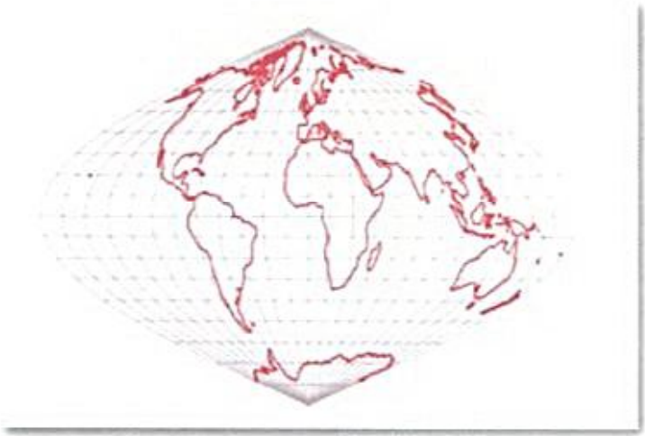
แผนที่มาตราส่วน 1:200,000 ของฝรั่งเศส ทำในระบบซิงูซอยดอล (Sinusoidal Projection) ทุกช่องสี่เหลี่ยมมีพื้นที่เท่ากัน

6 ทำไมจึงมี “พื้นที่อ้างสิทธิ์ทับซ้อน 4.6 ตารางกิโลเมตร” “พื้นที่อ้างสิทธิ์ทับซ้อน 4.6 ตารางกิโลเมตร” เป็นเรื่องที่เกิดขึ้นใหม่ไม่เกิน 10 ปีมานี้ โดยเป็นผลจากการที่กัมพูชาต้องการขึ้นทะเบียนปราสาทพระวิหารเป็นมรดกโลกฝ่ายเดียว โดยไม่ได้ปรึกษาหารือกับไทยตามที่เคยตกลงกันไว้ที่จะร่วมมือพัฒนาเขาพระวิหารและบูรณปฏิสังขรณ์ปราสาทพระวิหารเพื่อเป็นสัญลักษณ์แห่งมิตรภาพและความสัมพันธ์ที่แน่นแฟ้นและยั่งยืนระหว่างสองประเทศ ในการยื่นขึ้นทะเบียนเป็นมรดกโลกกัมพูชาต้องกำหนดพื้นที่กันชน (Buffer zones) รอบๆ ปราสาท ซึ่งได้ปรากฏแน่ชัดอย่างเป็นทางการต่อสาธารณชนในการประชุมคณะกรรมการมรดกโลกสมัยสามัญ ครั้งที่ 31 ที่เมืองโครสต์เชิร์ช ประเทศนิวซีแลนด์ ระหว่างวันที่ 23 มิถุนายน - 2 กรกฎาคม 2550 ว่าพื้นที่ที่กัมพูชาต้องการลำเข้ามาในดินแดนไทยประมาณ 4.6 ตารางกิโลเมตรหรือประมาณ 3,000 ไร่ ในการนี้กัมพูชาได้อ้างเส้นเขตแดนตามแผนที่มาตราส่วน 1 : 200,000 โดยถ่ายทอดเส้นตามที่กัมพูชาเข้าใจเอาเอง และไม่ตรงกับเส้นที่กัมพูชาอ้างในอดีต ปี 2505 ดังนั้นเรื่อง “พื้นที่อ้างสิทธิ์ทับซ้อน 4.6 ตารางกิโลเมตร” จึงเป็นปัญหาเขตแดนที่เกิดขึ้นใหม่ ซึ่งไทยและกัมพูชามีพันธกรณีต้องแก้ไขร่วมกันตามกฎหมายระหว่างประเทศโดยการเจรจาในกรอบคณะกรรมการจัดการเขตแดนร่วมไทย-กัมพูชา (JBC) ซึ่งเป็นกลไกทวิภาคีที่มีหน้าที่ในการแก้ไขปัญหาเขตแดน