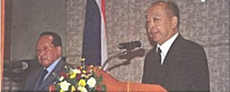
คำแถลงของนายสุรพงษ์ โตวิจักษณ์ชัยกุล รองนายกรัฐมนตรีและรัฐมนตรีว่าการกระทรวงการต่างประเทศ หลังการหารือกับรองนายกรัฐมนตรีและรัฐมนตรีว่าการกระทรวงการต่างประเทศและความร่วมมือระหว่างประเทศกัมพูชา ในวันที่ 28 ตุลาคม 2556 ณ เมืองปอยเปต จังหวัดบันเต็มเมียนเจย กัมพูชา

“เข้านี้ ผมได้หารือกับท่านฮอร์ นัมมิ่ง รองนายกรัฐมนตรีและรัฐมนตรีว่าการกระทรวงการต่างประเทศและความร่วมมือระหว่างประเทศกัมพูชา การหารือในครั้งนี้เป็นไปตามเจตนารมณ์ของท่านนายกรัฐมนตรียิ่งลักษณ์และนายกรัฐมนตรีสมเด็จฯ ฮุน เซน ที่จะรักษาความสัมพันธ์อันดี ความร่วมมือที่กำลังเป็นไปด้วยดีระหว่างกัน ตลอดจนความสงบสุขบริเวณชายแดนของประเทศไทยทั้งสอง ซึ่งเป็นเป้าหมายที่ผู้นำทั้งสองต่างยึดมั่นในแนวทางสันติมาโดยตลอด