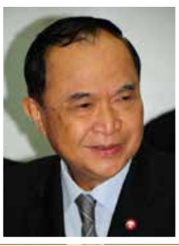
บทสัมภาษณ์ นายจรรพงค์ เรืองสุวรรณ รัฐมนตรีว่าการกระทรวงมหาดไทย โดยสำนักเลขาธิการพรรคเพื่อไทย